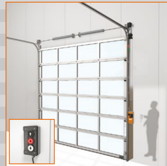
Tableau de commande supplémentaire

Lorsqu'une porte doit pouvoir être commandée depuis plusieurs lieux, ou pour la commande à distance depuis une loge de portier, par exemple, un panneau de contrôle supplémentaire est tout indiqué. Tous les boutons se trouvant sur le boîtier de commande standard sont également présents sur ce boîtier supplémentaire bien pratique.